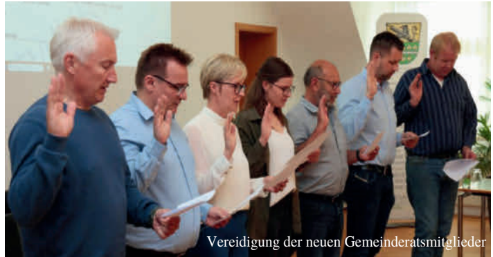
Vereidigung der neuen Gemeinderatsmitglieder