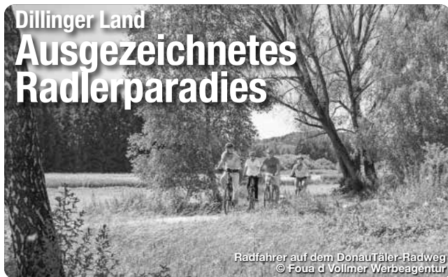
Radfahrer auf dem DONAUTÄLER-RADWEG

26.09. - 27.09.2026, Dillingen Im schönen Ambiente des Dillinger Schlossgartens präsentiert sich der weit bekannte Töpfermarkt. Das Angebot zahlreicher Keramiker umfasst die gesamte Bandbreite dieses alten Handwerks, von Gebrauchskeramik über Dekorationen bis hin zu Schmuck und Skulpturen.