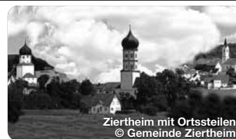
Ziertheim mit Ortsstellen

Die Stadt Gundelfingen a.d. Donau hat mit den Stadtteilen Peterswörth und Echenbrunn über 8.000 Einwohner. Das Stadtbild ist geprägt vom Mittelalter und erhielt im Jahr 1220 die Stadtrechte. TreffpunktDeutschland.de/gundelfingen