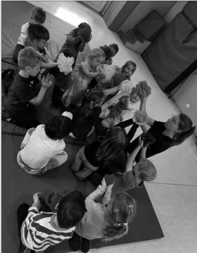
Zirkus-Zaubertrick die „blühenden Blumen“