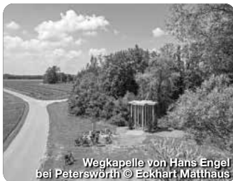
Wegkapelle von Hans Engel bei Peterswörth