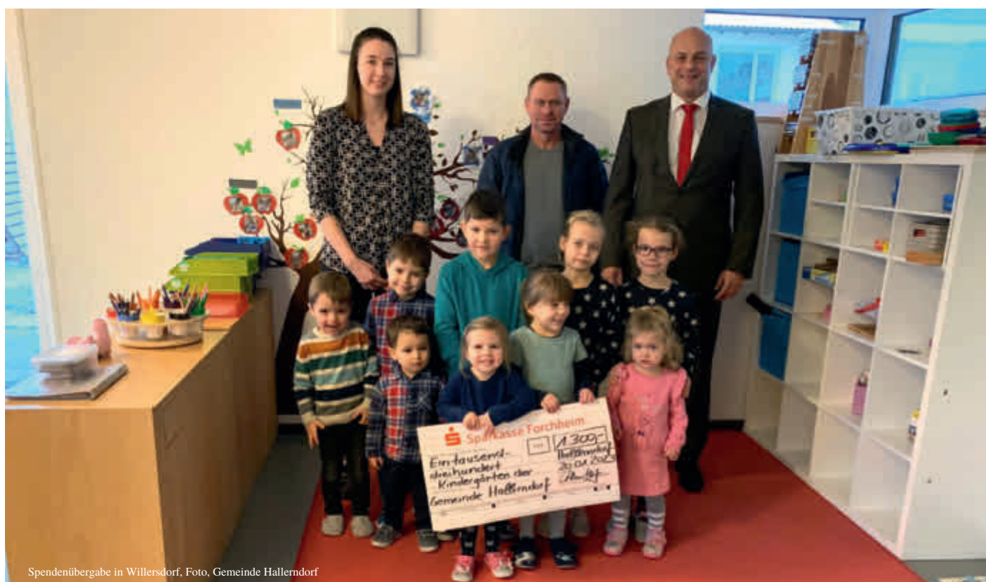
Spendenübergabe in Willersdorf

Auch in diesem Jahr fand wieder eine Christbaumsammelaktion in der Gemeinde Hallerndorf statt. Am Samstag, 07.01.2023 sammelten wieder viele ehrenamtliche Helferinnen und Helfer die ausgedienten Christbäume in den acht Ortsteilen der Gemeinde ein.