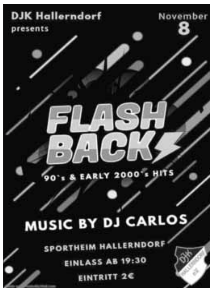
Plakat: Simon Körber